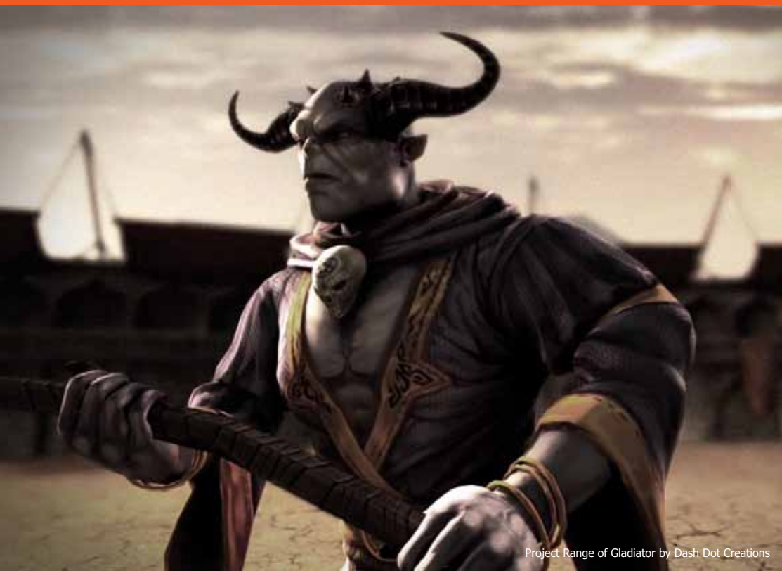
Project Range of Gladiator by Dash Dot Creations