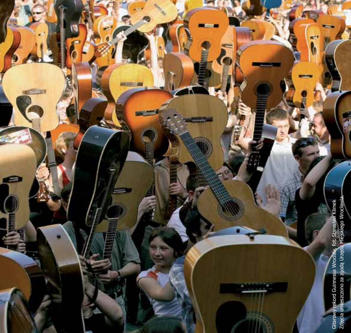
Gitarowy rekord Guinnessa Wrocław, fot. Stanisław Klimek Zdjęcia umieszczono za zgodą Urzędu Miejskiego Wrocławia.

www.wns.dsw.edu.pl www.wns.ua.dsw.edu.pl