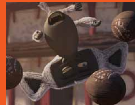
Project Monkey DOJO by Dash Dot Creations